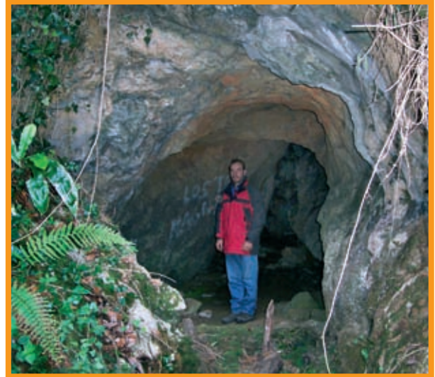
Boca de la Cueva de los Moros.

2005 , continuamos explorado la galería San salvador, con pequeñas desviaciones a ambos lados, terminando en la Sala Cabarga con varias galerías obstruidas por derrumbes siendo esta la sala mas grande de la cueva.