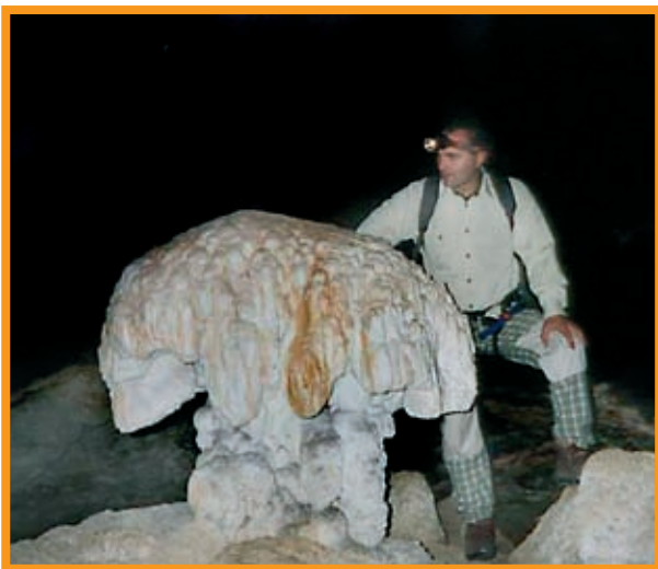
Estalagmita con forma de seta.

Una vez superado el paso de la cornisa del salto, la galería continua por una repisa ancha que a los pocos metros nos obliga a destrepar un resalte de unos cinco metros.