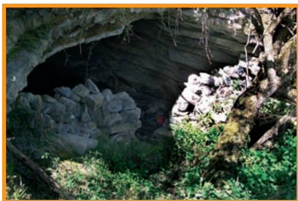
Boca de la Cueva del Poyo (Saja-Los Tojos).