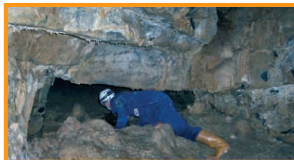
Exploración en la cueva del Poyo.