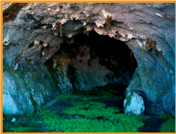
Boca de la Cueva de la Mora.