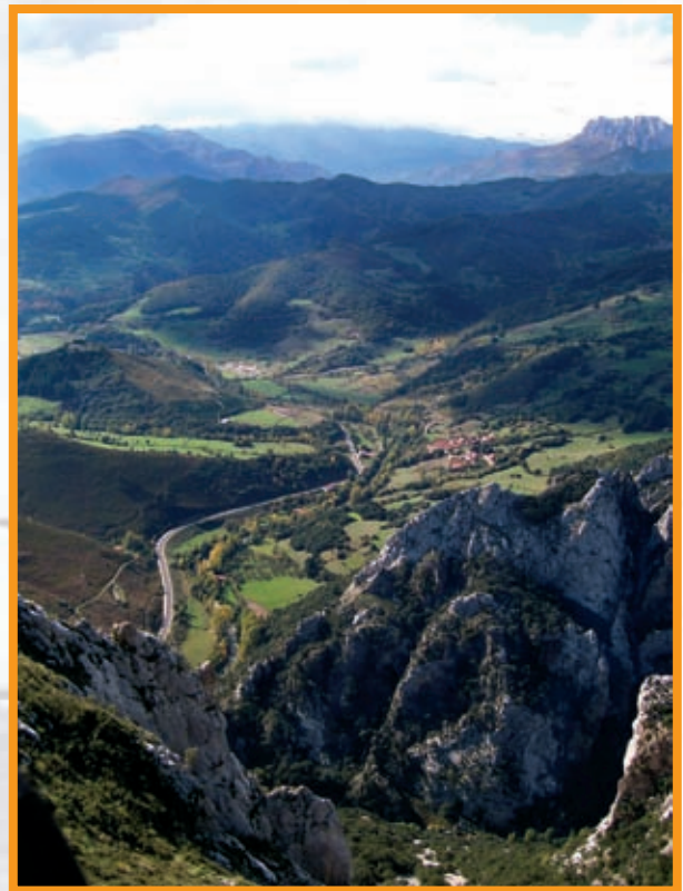
Vista desde el camino de acceso a la cueva. (José Luis Alonso)

zada con unas marcas de ruta (blancas y amarillas), la pista se va estrechando progresivamente convirtiéndose en un sendero y situándonos por detrás de una curiosa formación rocosa (con forma de aguja) éste continua por la derecha llegando a un manantial donde se bifurca en dos direcciones, tomamos el de la izquierda comenzando una ascensión que nos llevará alrededor de 1'30 horas aproximadamente por una empinada canal cubierta de robles y hayas ganando altura progresivamente hasta llegar a un claro.